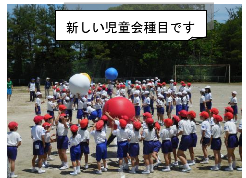
新しい児童会種目です

そして、昨日予行が行われました。熱中症対策として児童用のテントを設営しました。子どもたちは、元気一杯で最後まで頑張りました。尚、運動会当日は、高温が予想されます。前日は、激しい運動は控え、早めに休むなどの体調管理をよろしくお願いいたします。