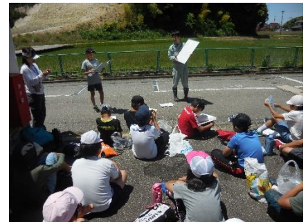
生息数発表の様子

物の表を見ながら、記録用紙に自分たちが採集した生物の数を水質階級別に記録しました。そして、班ごとに発表しました。その結果、ミズムシ1匹、タニシ類4匹、えらミミズ1匹、アメリカザリガニ246匹で、水質はとても汚れているという判定になりました。