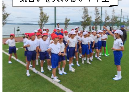
気合いを入れる3・4年生