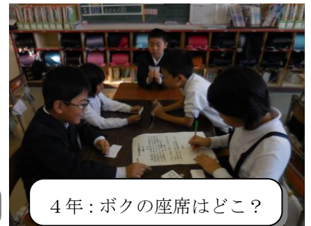
4年：ボクの座席はどこ？