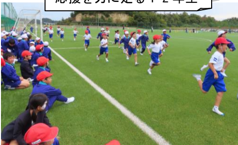
応援を力に走る1・2年生