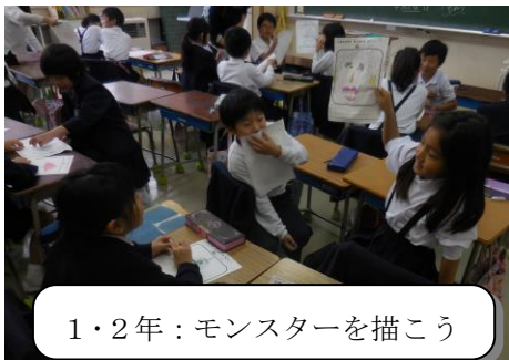
1・2年：モンスターを描こう

また、11月5日（火）～8日（金）を教育相談ウィークとして、「なかよしアンケート」を実施する予定です。5月に実施した1回目と同様に、アンケート集計後は全員との面談、いじめの有無などの聞き取りを行い、職員で共通理解や対応を協議します。