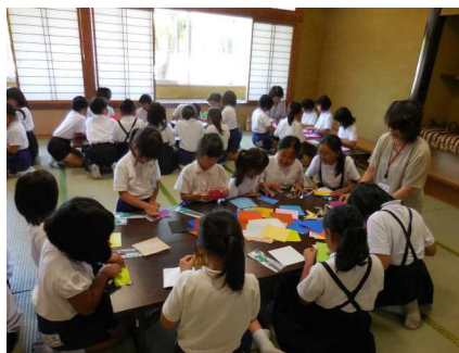
(折り紙を折る子どもたち)