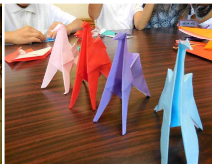
(出来上がった作品)