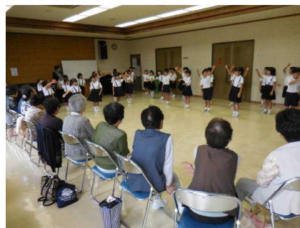
(和楽会と子どもたち)