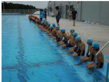
(入水前の注意を聞く)