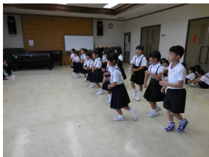
(1年生のおむすびころりん)

和楽会の皆さんから自己紹介の折には「頑張ってる」「すごいね」と、出し物の折には、動きをまねたり、拍手が起こるなど、大変喜んでいただきました。最後は、「とても楽しかった」「夢を叶えてね」と声を掛けていただき、握手でお別れしました。