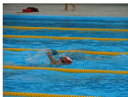
(一生懸命に泳ぐ子どもたち)