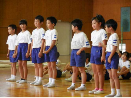
<演技の説明をする子ども達>

10日(土)、9時より、本校の体育館で3年生のPTCAを行いました。はじめに、今月7日(水)に山王小学校で行われた器械運動交歓会での種目マット、鉄棒、跳び箱を、保護者の前で披露しました。交歓会当日に怪我等で発表できなかった子どもも、この日は、得意な種目を保護者の前で披露していました。後半は、保護者も入って、親子でドッジボールを行いました。始めは控えめだった保護者の方々も、次第に熱が入り、大変盛り上がっていました。たくさんの保護者の方に参加していただき、ありがとうございました。