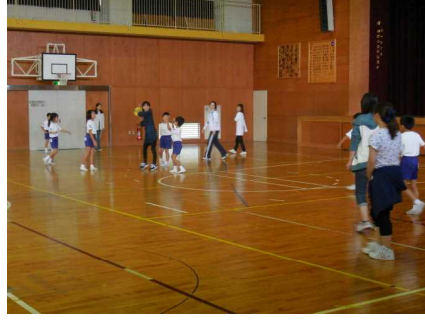
<ハッスルする保護者の皆さん>