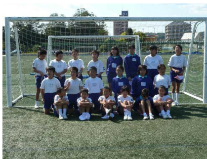
<終わった後のハイ・チ〜ズ!>