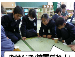
おはじき(綺麗だね！)