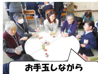
お手玉しながら コミュニケーション