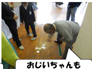
おじいちゃんも メンコでハッスル！