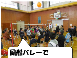
風船バレーで 力が入ります！