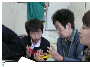
あやとり(難しいなあ～)