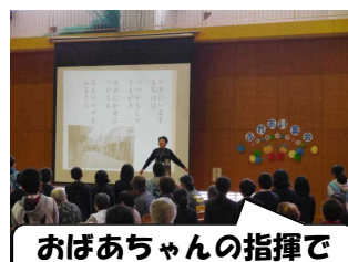
おばあちゃんの指揮で 全員合唱