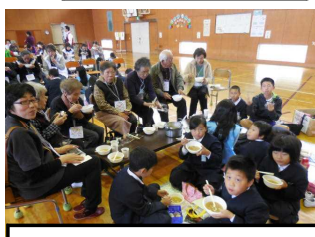
お昼(おにぎりと豚汁)