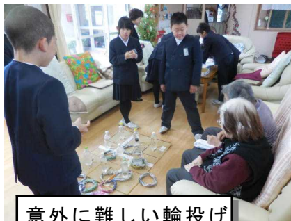
意外に難しい輪投げ