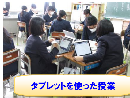
タブレットを使った授業

新型コロナの影響により様々な活動が制限される中での1年間でしたが、和倉っ子は、「笑顔いっぱい、元気いっぱい」の毎日を送りました。これも地域の皆様、保護者の皆様のご協力のおかげと感謝申し上げます。ありがとうございます。