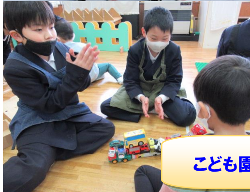
こども園訪問での自由遊び !