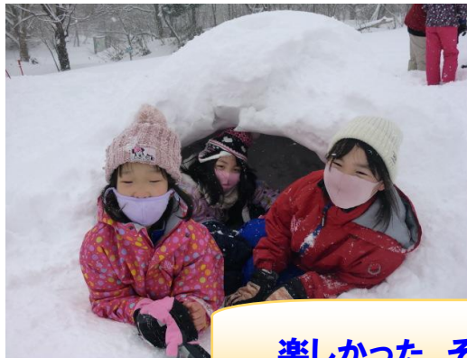
楽しかった そり活動 & スキー活動 !