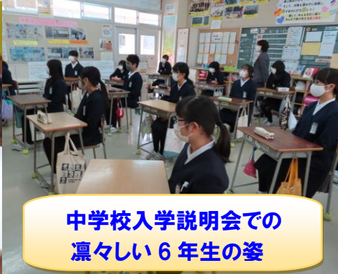
中学校入学説明会での凛々しい6年生の姿