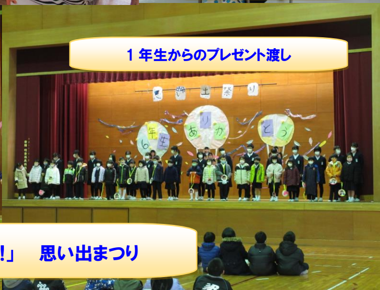
1年生からのプレゼント渡し