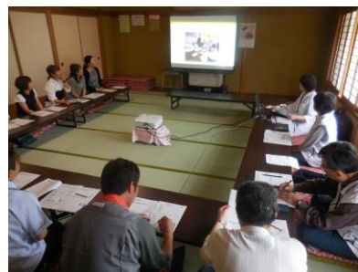
学校給食についての話