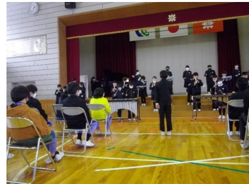
三年 雑草の歌(群読)と 合奏