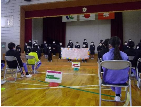
二年 これなくんだ？

3月2日の「6年生を送る会」では、在校生が出し物とメッセージをおくり、6年生の卒業をお祝いしました。どの学年も、6年生に向けての感謝とお祝いの気持ちを込めたとても素敵な発表で、会場は大いに盛り上がりました。保護者の皆様の来校は6年生に限定させていただきましたが、会場が一体となってとても良い会となりました。