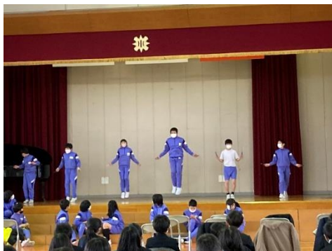
六年 引き継ぐ (なわとびとダンス)