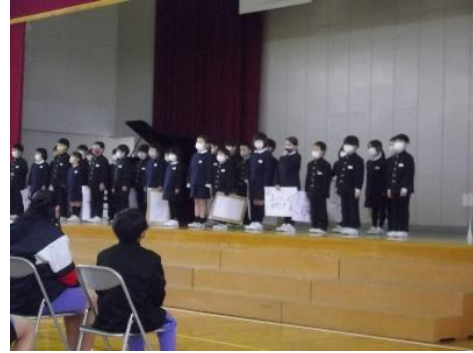
一年 思い出クイズ