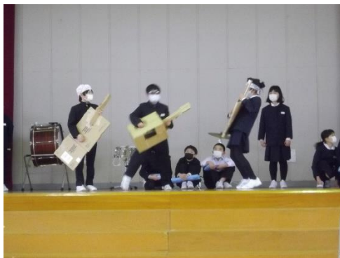
四年 こわれた千の 楽器演奏会(劇)