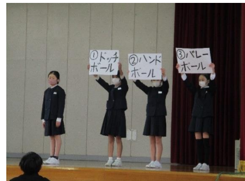
五年 先生のものまねクイズ