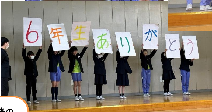
後輩たちを温かく見守る 6年生

6年生「未来の自分に向けて」 これからも笑顔 を忘れず挑戦し ていてほしい です。