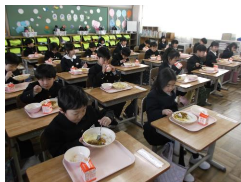
＜小学校で初めての給食を食べる1年生＞