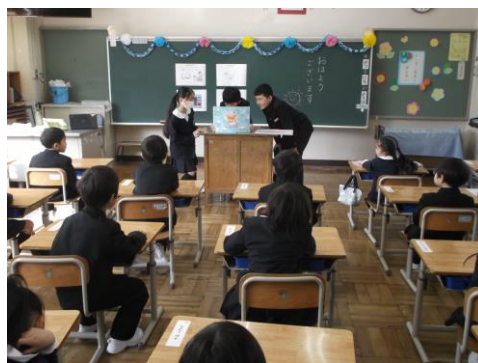
＜1年生に紙芝居を読み聞かせする6年生＞