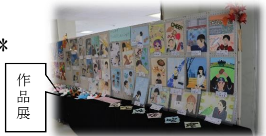
作 品 展