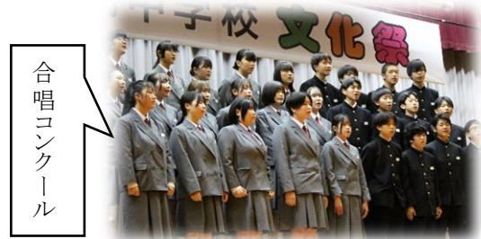
合唱 コン クール