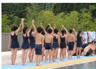
プールへの入り方お手本① バディシステムでの人数確認