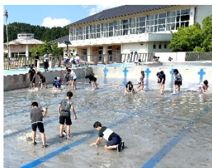
5・6年生が 頑張りました

今年はより安全に学習を行うため、低・中・高の2学年での合同授業とし、3人の教員で指導と安全管理にあたります。そのため、1学期末までは特別時間割となりますので、学級からのお知らせや連絡帳などでご確認ください。