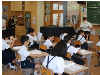
授業参観の様子（5年音楽、2年道徳）