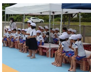
プール清掃への お礼の言葉（4年生）