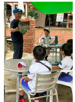
↑ケロンの小さな村