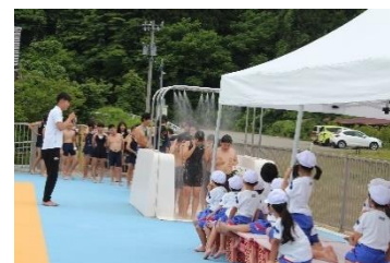
プールへの入り方お手本② シャワーの浴び方