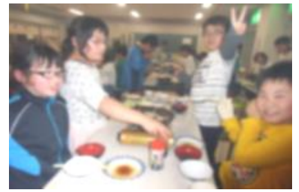
【バーベキューで手際のいい子はだれ?】