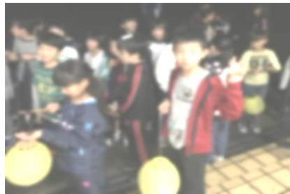
【行きは余裕の肝試し】