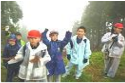
【しんどかった雨の白抜山登山】