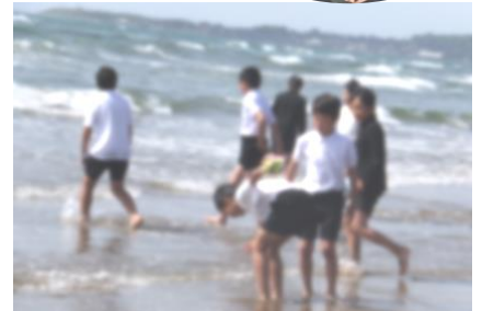
【千里浜で波とたわむれ】