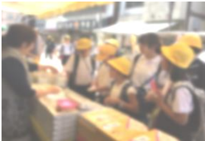
【輪島朝市での値段交渉】