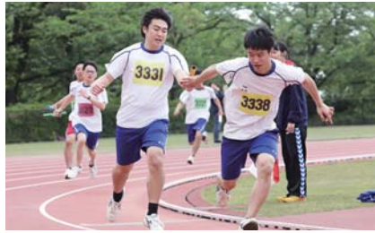
中高合同校内スポーツフェスティバル

中高合同校内スポーツフェスティバル PTA総会 1学期中間試験 1年遠足 県総体・総文壮行式 県高校総体・総文