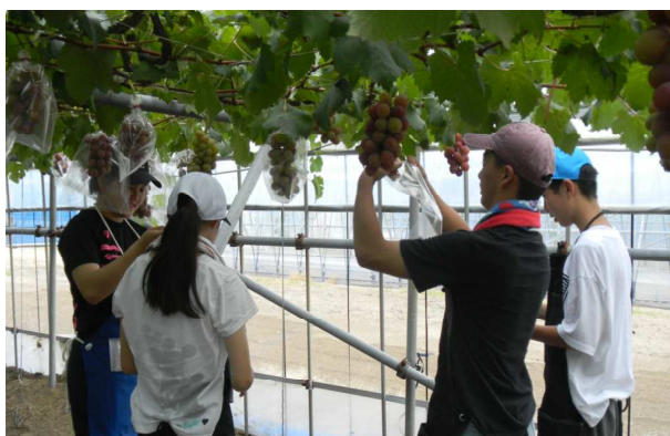
[ぶどうに袋を被せています（農業試験場にて）]

今回の職場体験では、「挨拶」が大切なのだと思いました。出勤した時や、退社するときに挨拶するのは当たり前だけど、廊下などで職員の方とすれ違うときに会釈をしたりするのは、宇中で鍛えられたなと思い出しました。これからも、宇中でも地域でも「挨拶」をしていきたいです。